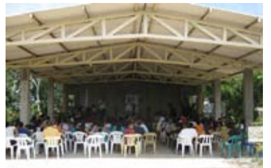
El nuevo templo en plena construcción.

Hablar en términos reales de lo que puede hacer el Señor... en ocasiones resulta más difícil de creer que la misma ficción. Dios sigue sorprendiendo.