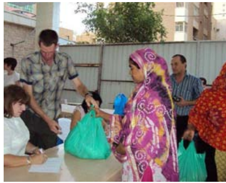
la labor social y de servicio en el país de Kuwait.