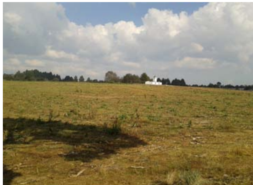
Vista panorámica del ejido Laguna Seca, en el Valle de México.