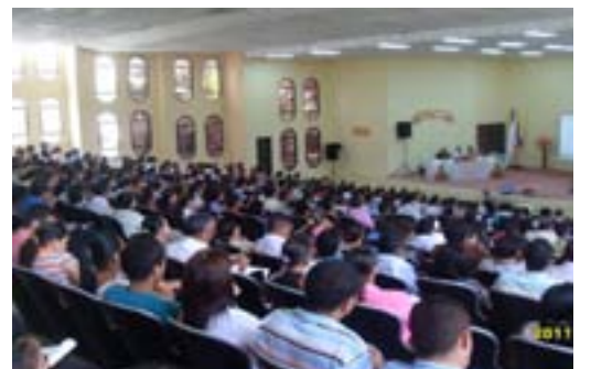
Una sesión durante la Cumbre Internacional de Liderazgo.